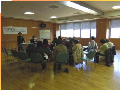
ウィメンズカウンセリング松山