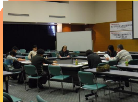
NPO 松山冒険遊び場みんなだいすき!