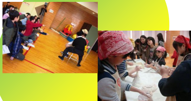
松山市新玉児童館