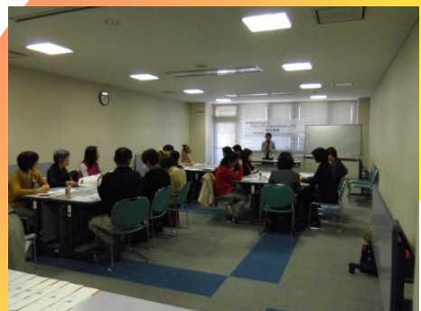
特定非営利活動法人 日本交流分析協会 四国支部有志