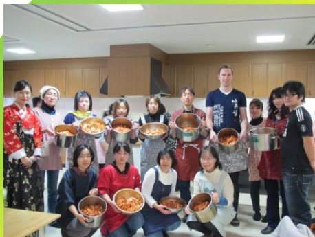
まつやま国際交流センター