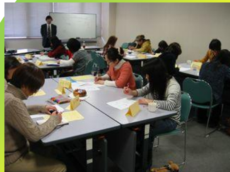
まつやま NPO サポートセンター