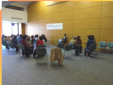
ギャンブル依存を考える会