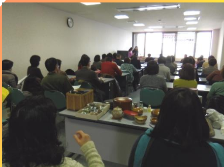
子どもたちに明るい未来をNET