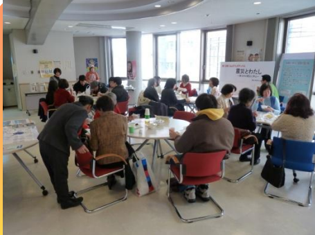
男女共同さんかくの会