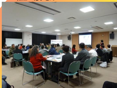
男女共同さんかくの会 女性と防災グループ