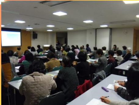
愛媛県女性保護対策協議会