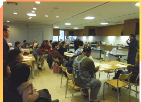
サ行の会（コムズ元運営推進委員有志）