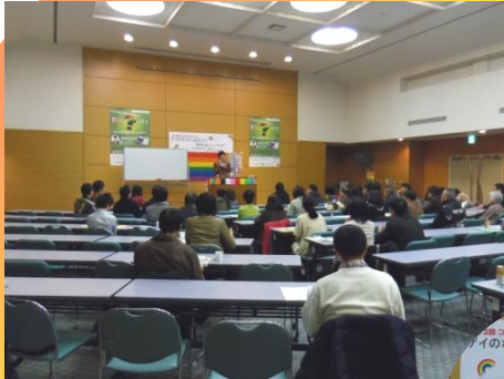
レインボープライド愛媛