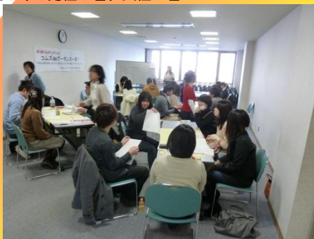
NPO 法人ワークライフ・コラボ XNPO 法人 Eyes

コミュニケーションとストロークで自分発見 ～交流の癖を知ってコミュニケーション上手を目指そう～