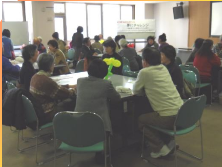
ウェルエイジングクラブまつやま (WACM) 男女共同さんかくの会 高齢社会グループ