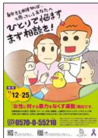
H27 年度内閣府ポスター