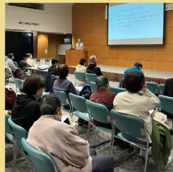
松山市鍼灸師協会