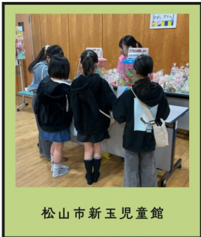
松山市新玉児童館