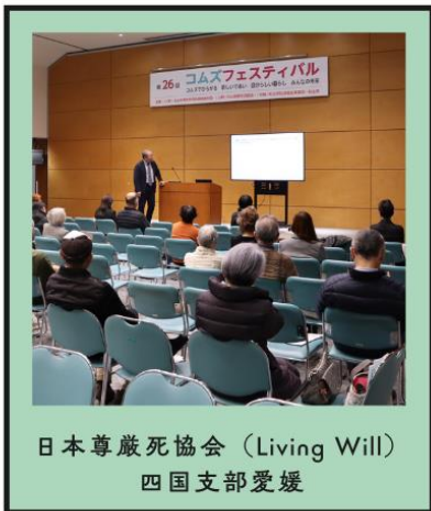
日本尊厳死協会 (Living Will) 四国支部愛媛