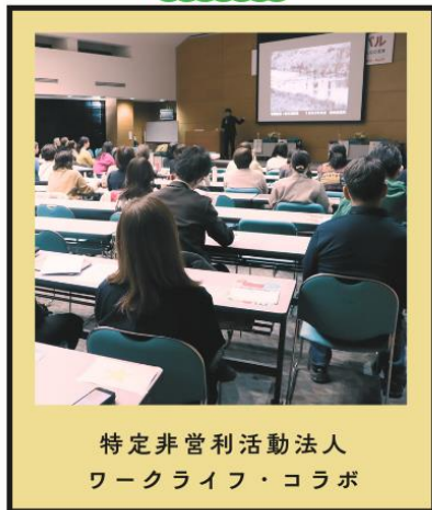
特定非営利活動法人 ワークライフ・コラボ