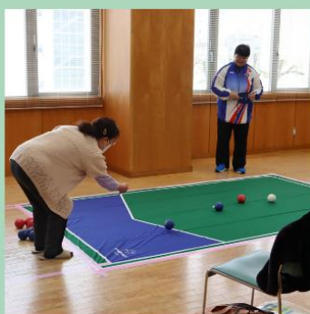
(公社)愛媛県鍼灸マッサージ師会