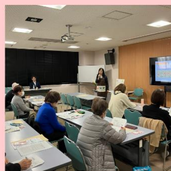
ウエルエイジングクラブまっやま