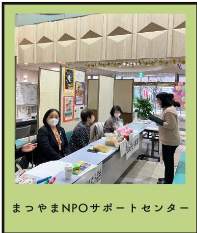
まつやまNPOサポートセンター