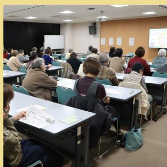
高齢社会を生きる会