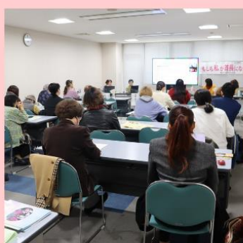
議会に女性をおくる会