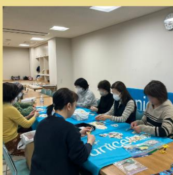
愛媛県ユニセフ協会