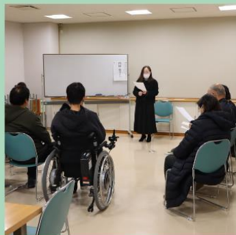
特定非営利活動法人 働く人 とその家族サポートセンター

2日間にわたり、さまざまな市民企画イベントを行いました♪ その一部をご紹介します。