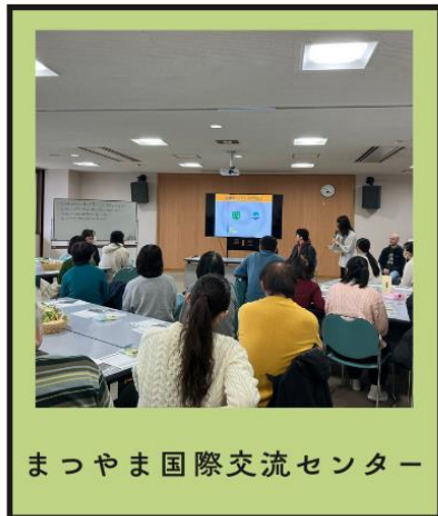
まつやま国際交流センター