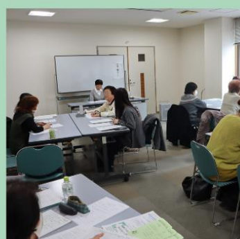
ウィメンズカウンセリング 松山