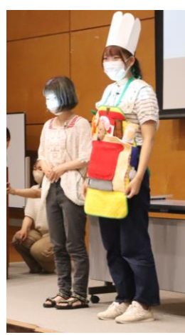
エプロンシアター