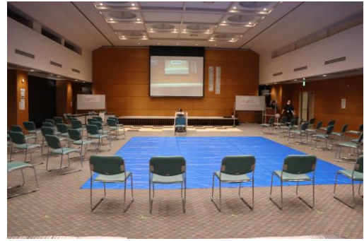
くつろげるようにシートエリアやジョイントマットエリアを設置