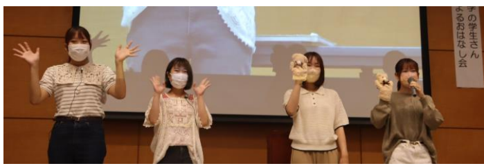
ミトンを使ったおはなし