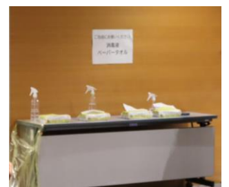
シート消毒用に除菌セットも準備