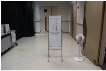
ベビーカー置き場を5階に設置