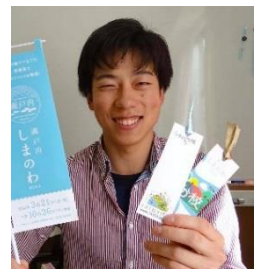
愛媛の魅力を発掘中

留学生のために“つながり”と“学び”の場にもなるシェアハウスを開設。入居者だけではなく、そこにかかわる人や地域を幸せにすることを目指して活動。「空き家」問題も含め、地域とのつながりを考えてみませんか。