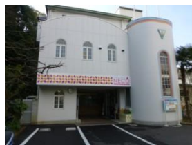
活動拠点のシアターねこ(緑町)

緑町の劇場「シアターねこ」を拠点に、芸術文化の発信、発展を目指す「シアターネットワークえひめ」。40代で役者から演劇界の人材育成に携わる立場へと転身。芸術文化を通じた豊かな社会づくりについて考えてみましょう。