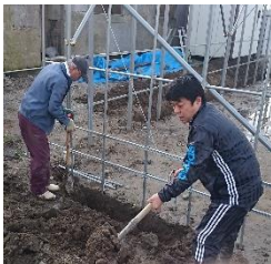
農業ハウス建設に汗を流す

「目指すのは“カッコイイ農業”というhプロジェクト。農業の6次産業化、農林水産省の推進する「農業女子プロジェクト」への参画、「愛の葉プロジェクト」など若者や女性の視点を取り入れた「農業+α」の取り組みについてともに考えましょう。