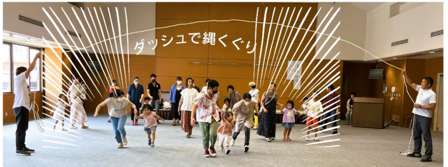
ダッシュで縄くぐり