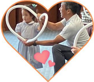
ハートに見えるかな？