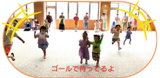
ゴールで待ってるよ