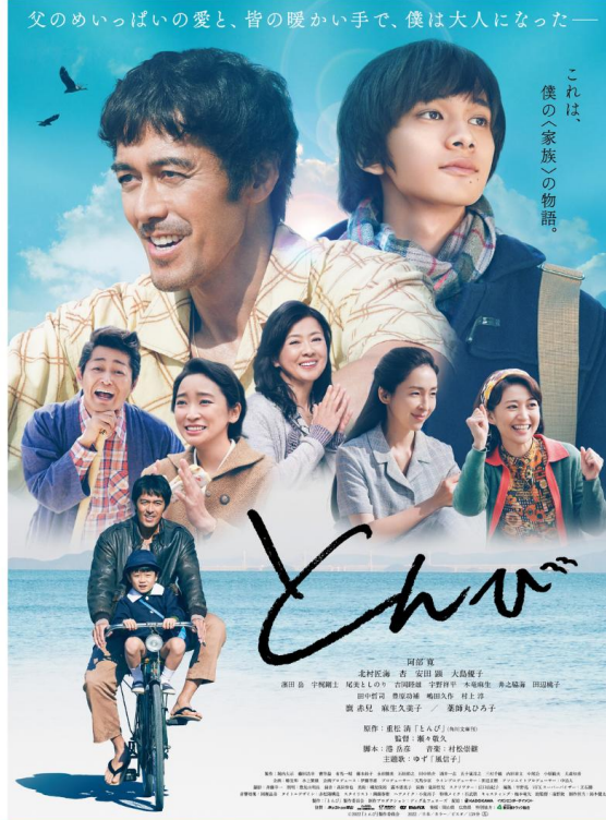
重松 清 永遠のベストセラー、親子の絆を描く感涙の名作、待望の初映画化